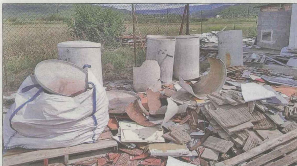
Una part del material d'amiant abocat al voltant d'una nau industrial

La Guàrdia Civil va localitzar material "deteriorat" que considera tòxic